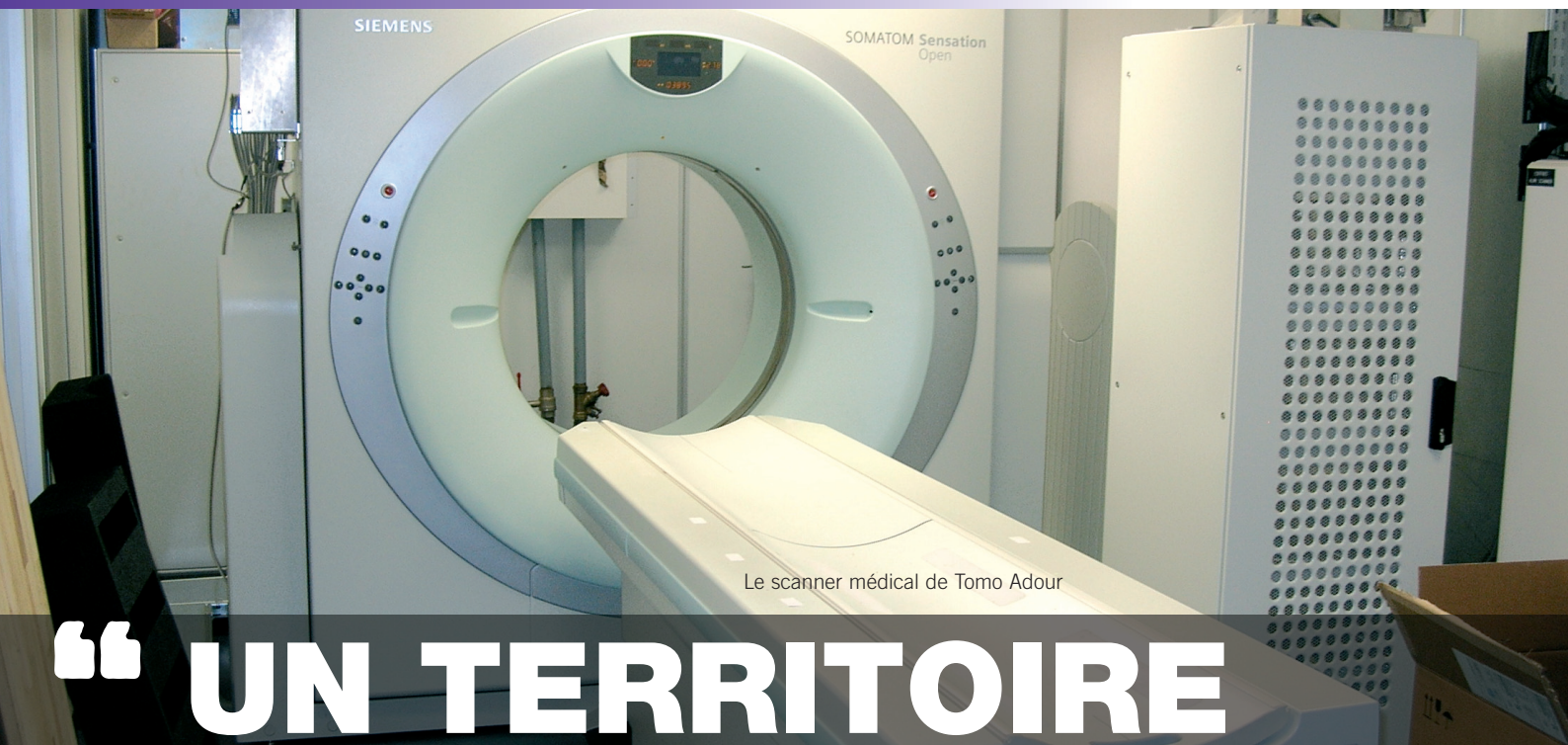
Le scanner médical de Tomo Adour